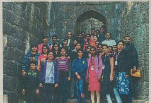
पुरंदर ( सासवड ) : भारतीय जैन संघटना महाविद्यालयातील विद्यार्थ्यांनी सासवडजवळील पुरंदर या ऐतिहासिक किल्ल्यावर जाऊन इतिहास जाणून घेतला.

वाघोली, ता. ५ : भारतीय जैन संघटना महाविद्यालयातील विद्यार्थ्यांनी सासवडजवळील पुरंदर या ऐतिहासिक किल्ल्यावर जाऊन किल्ल्याचा इतिहास जाणून घेतला.